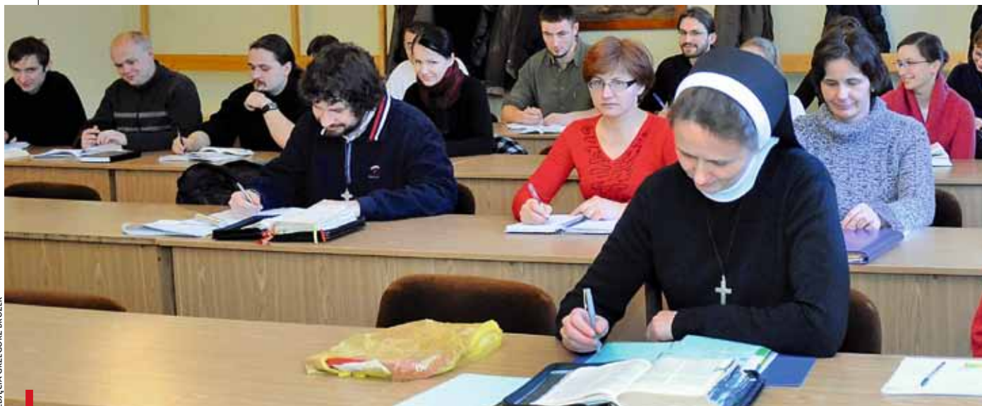
Na WT studują alumni seminarium, świeccy i siostry zakonne PONIŻEJ Z PRAWYJ: Od kilku lat seminarium i wydział mieszczą się w tym samym budynku przy Piłsudskiego 6