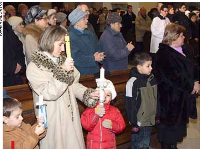
Całe rodziny z zapalonymi świecami odnawiały przysięgę chrzcielne

przez Ojca w mocy Ducha Świętego dla zbawienia człowieka. Z drugiej strony kieruje uwagę na rzeczywistość chrztu. Chrzest w Jordanie był uroczystym wprowadzeniem Jezusa w działalność mesjańską, której szczególnym rysem jest wypełnienie woli Ojca przez wydanie się w ofierze prześlągalnej za nasze grzechy. Pokorna solidarność z grzesznikami doprowadziła go do śmierci na krzyżu. To właśnie tam wysłużył nam łaskę zbawienia, która stała się naszym udziałem przez sakrament chrztu świętego. Świętując jubileusz powstania diecezji, chcemy dziękować Bogu za łaskę chrztu, zarówno naszego, jak i wielu pokoleń synów i córek Kościoła tarnowskiego w jego 225-letniej historii. ak