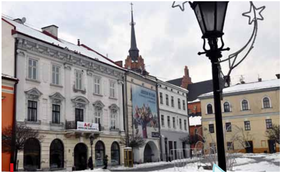
Kamienica przy Rynku 4 była historycznie drugą siedzibą biskupów tarnowskich

– Nie, nie musiała. Jestem przekonany, że gdyby nie było I rozbioru Polski, to nigdy by nie powstała, bo zbyt blisko była Krakowa, który był zawsze centralnym ośrodkiem. Powstała, bo tak chciał cesarz, a papież zgodził się i wydał odpowiednie prawo. Myślę jednak, że w tych wydarzeniach powinniśmy dostrzeżać działalność Bożej Opatrzności. ■