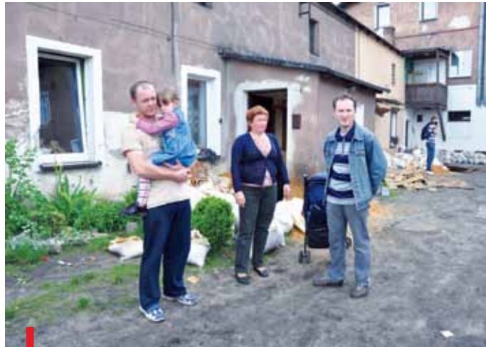
Powodzianie z Zawadzkiego z niepokojem patrzą w przyszłość. Kilka domów może nie nadawać się do zamieszkania