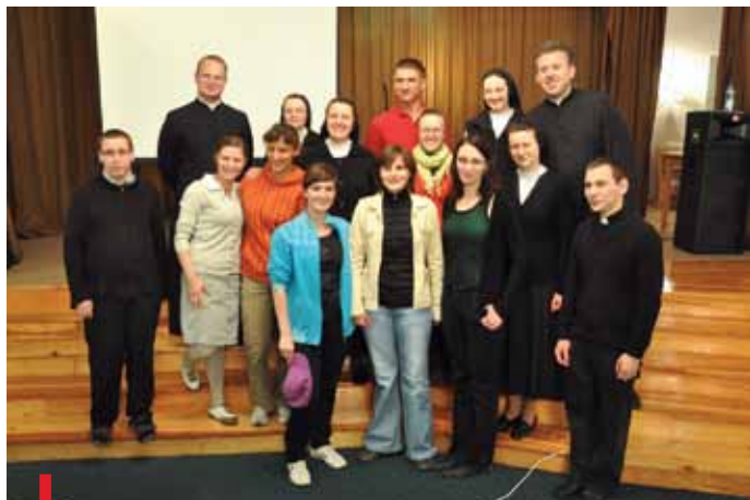
Siostry szkolne wraz ze studentami i duszpasterzami, którym dedykowały koncert