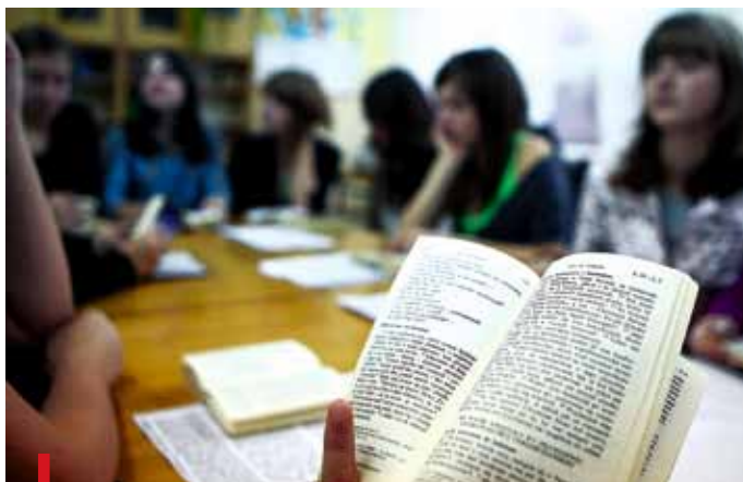
Czytanie i rozważanie tekstów biblijnych jest ważnym elementem chrześcijańskiego życia

Od 18 do 24 kwietnia podobnie jak w całej Polsce, również w naszej archidiecezji odbywały się spotkania, podczas których promowano Pismo Święte. W parafii św. Stanisława w Żorach przez cały ten tydzień co wieczór czytano Dzieje Apostolskie w ramach tzw. lectio continua (czyli czytania ciągłego). W piątek 23 kwietnia zorganizowano tam Noc z Pismem Świętym. Były wykłady, rozważanie biblijnych tekstów w kręgach, a także Eucharystia.