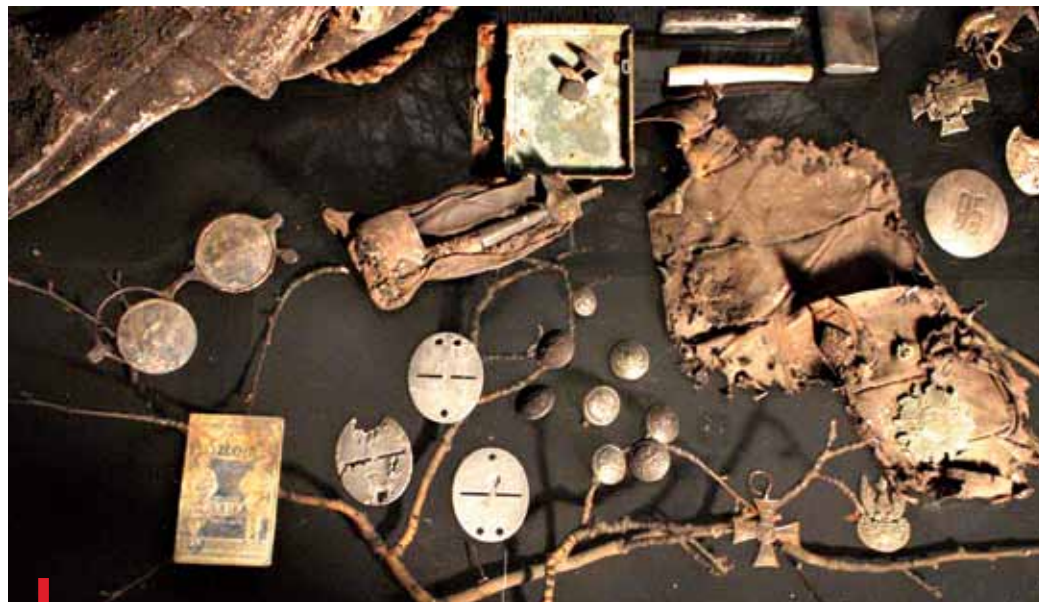
ARCHIWUM MUZEUM KATYŃSKIEGO

Wzorem Muzeum Oświęcimskiego czy Muzeum na Majdanku, Muzeum Katyńskie w Cytadeli,