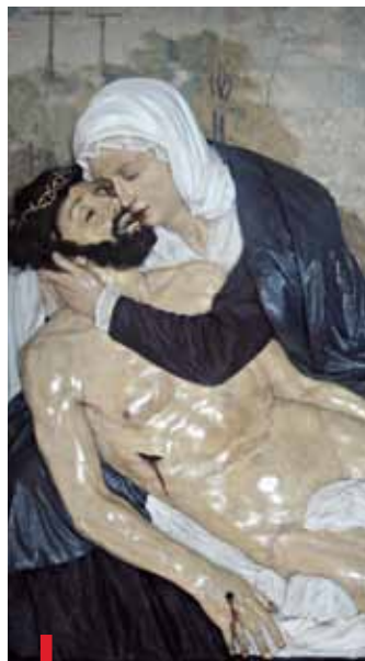
Płaskorzeźba po renowacji wraca do Góry Kalwarii

Podwyższenia Krzyża Świętego. Zostanie podświetlona i odpowiednio wyeksponowana. ap