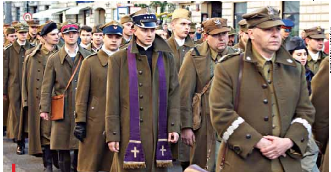
Połowa młodych ludzi nie wie, co wydarzyło się w Katyniu. 11 kwietnia Katyński Marsz Cieni spod Muzeum Wojska Polskiego do pomnika Poległych i Pomordowanych na Wschodzie ma im to przypomnieć

– Kolejne obchody zbrodni katyńskiej przypominają, że jej ofiary