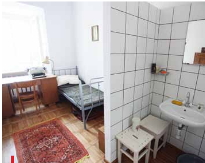
W tym seminaryjnym pokoju mieszkał Jerzy Popiełuszko

Kilka dni po obłóczynach, na drugim roku, kleryk Jerzy dostał