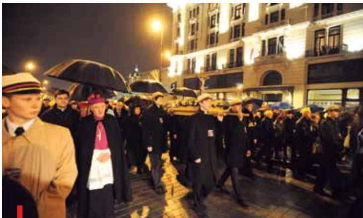
Podczas warszawskiej Drogi Krzyżowej mieszkańcy stolicy wspominali Jana Pawła II i modlili się o jego beatyfikację

Podczas Drogi Krzyżowej wierni mogli wysłuchać słów Jana Pawła II, które wypowiadał do rodaków. Na placu Piłsudskiego o godz. 21.37 w wyjątkowy sposób rozważano 12. stację Męki Pańskiej. Z tłumu wiernych na niewielką scenę wychodzili aktorzy, co sprawiało wrażenie, że wszyscy obecni na placu są świadkami ukrzyżowania.