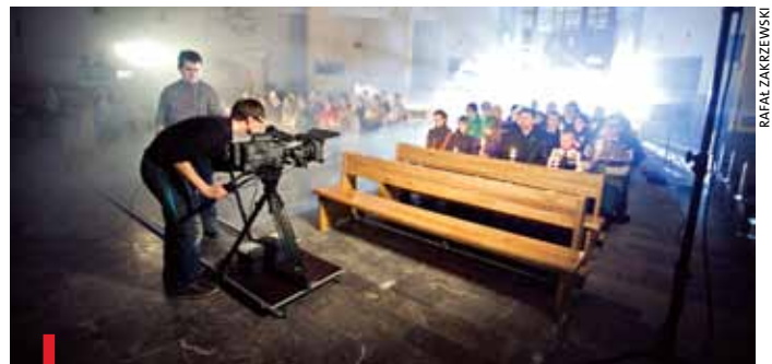
Sesja zdjęciowa Holy Is His Name . Premiera teledysku pod koniec kwietnia