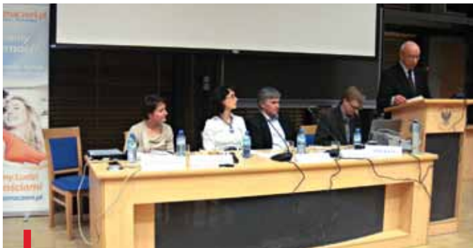
Poruszyli Niebo – na ziemi opowiadając o aborcji...