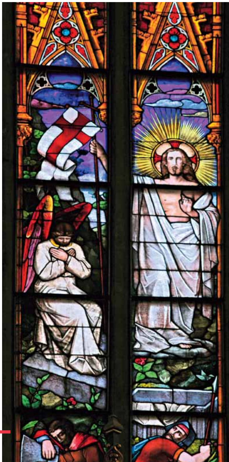
NA ZDJĘCIU: Chrystus Zmartwychwstały z kościoła kalwaryjskiego w Piekarach Śląskich