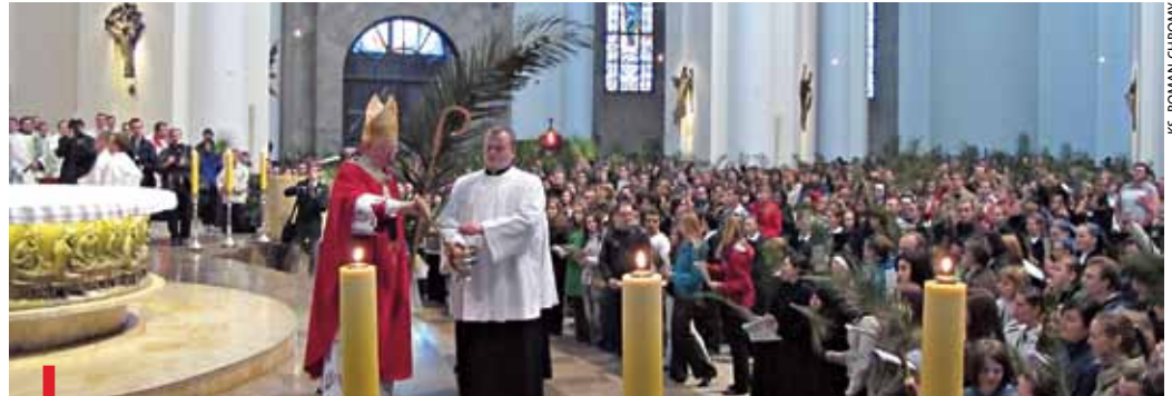
Obchody Światowego Dnia Młodzieży w katowickiej katedrze dowodzą, że na młodych można liczyć