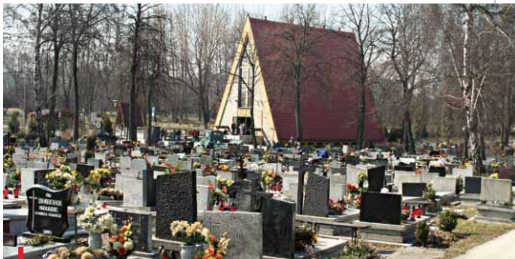
Siemianowicki kościół pw. Zmartwychwstania Pańskiego był kiedyś kaplicą cmentarną

Podobna symbolika wyłania się ze wzgórza w Kalwarii Pszowskiej. To właśnie tam, na styku Krzyżkowic, Pszowa