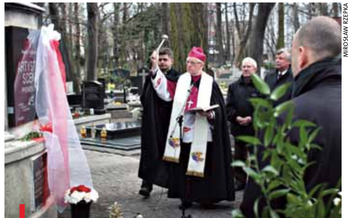
Tablica jest wmurowana w ścianę kaplicy cmentarnej