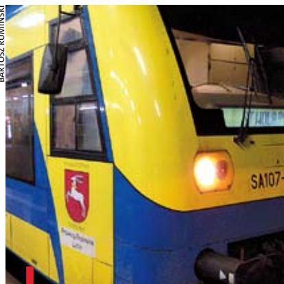
Podobne szynobusy będą wozić pasażerów na lotnisko. Teraz kursują m.in. z Lublina do Rzeczyca czy Stalowej Woli