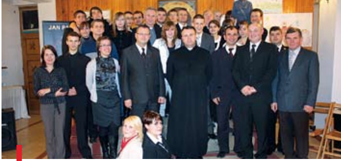
Członkowie KSM Świdnik wspólnie z gośćmi zaproszonymi na jubileusz