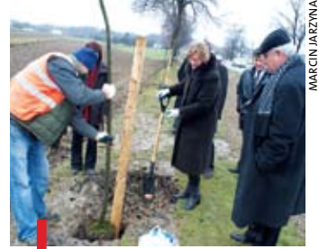
Również wojewoda lubelski Genowefa Tokarska chwyciła za łopatę

Niedawno w mediach pojawiła się informacja o dwukrotnym uroczystym otwarciu kilku kilometrów drogi na Mazowszu. U nas też ostatnio wyremontowali drogę. Nie było jednak wielkiej pompy.