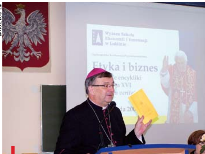
Wykładnię encykliki przedstawił m.in. abp Józef Życiński