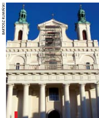
Odnowiony front lubelskiej archikatedry

ARCHIKATEDRA. Kolor piaskowy ma od niedawna elewacja lubelskiej bazyliki archikatedralnej św. Jana Chrzciciela. Po kilku miesiącach zakończyła się pierwsza część remontu. Barwa nie jest przypadkowa; według konserwatorów tak kościół wyglądał kilkaset lat temu. Na zewnątrz pojawił się monitoring. Jest zatem szansa, że nie będą powtarzać się akty wandalizmu (pisanie po murach). W przyszłym roku rozpocznie się kolejny etap odnawiania. Do tej pory remont kosztował ponad 1,6 mln zł.