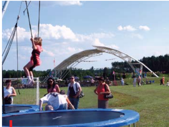
Najmłodsi mogli poskakać na linie, dla rodziców na scenie występowały zespoły

Rodzinnych atrakcji nie zabrakło dla nikogo, szczególnie dla najmłodszych. Dla nich przygotowano m.in. dmuchany zamek, loterię i koło fortuny. Dzieci miały też możliwość poskakania na linach