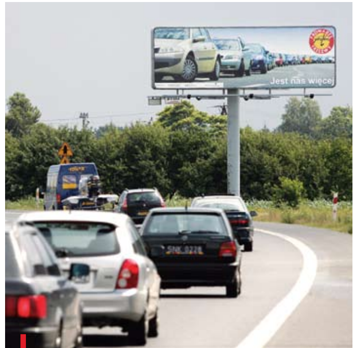
Plakaty kampanii w sierpniu pojawią się na ulicach Toszeckiej i Sikorskiego w Gliwicach

Emisje w telewizji zaplanowane są na wszystkie długie weekendy 2009 roku. Pojawiają się też specjalne naklejki na tyłach autobusów i samochodów osobowych.