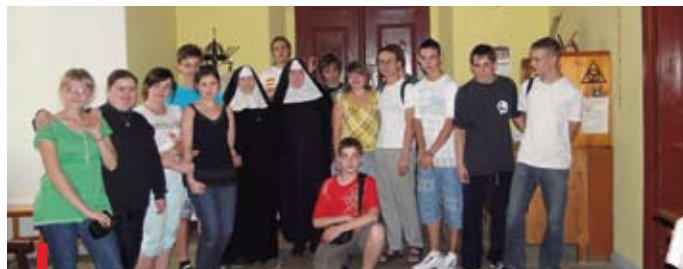
Młodzież odwiedziła siostry benedyktyńki w Krzeszowie