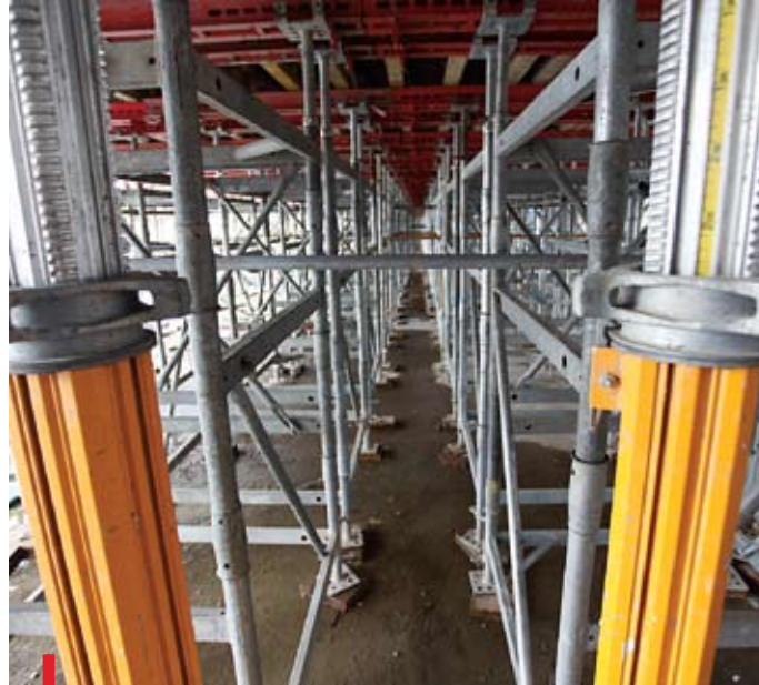
Wnętrze świątyni wypełnia na razie las rusztowań. Kiedy zniknie, odsłoni przestrzeń sakralną mieszczącą cztery tysiące wiernych. Wotum narodu ma być gotowe w 2012 r.

wieku: Jana Pawła II i kard. Stefana Wyszyńskiego.