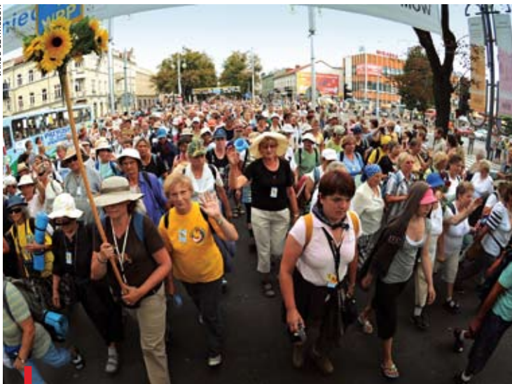
Jaką pielgrzymkę wybrać? Stali pielgrzymi już wiedzą. Nowi – mogą przeczytać za tydzień „Gościa”

unikalne przeżycie duchowe, że coraz częściej chcą go doświadczyć także „zazdrośni” obcokrajowcy. Jedyny kłopot, jaki stoi przed potencjalnym pielgrzymem, to wybór tej najodpowiedniejszej. Licząc tylko największe