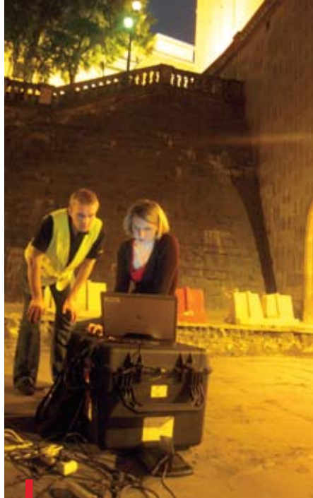
Grupa geologów z WAT robi pomiary przy kościele św. Anny

W latach 50. zaczęto więc ratować skarżą, a tym samym – świątynię. Zastosowano jednocześnie kilka zabiegów konserwatorskich: m.in. dookoła kościoła nawiercono bardzo długie żelazno-betonowe słupy o długości do 70 metrów i średnicy 30 centymetrów. Wybudowano także dwa mury oporowe, które miały za zadanie utrzymać skarżą na miejscu. W rezultacie