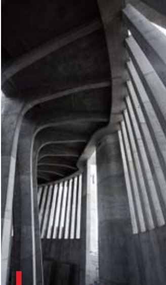
Budowa Centrum Opatrzności Bożej to jedno z najpoważniejszych wyzwań architektonicznych w Europie