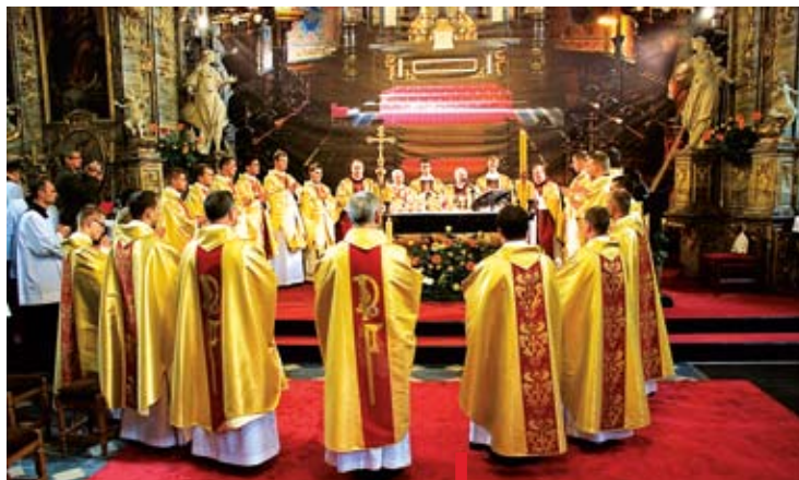
Kapłani w swojej postudze liczą bardzo na modlitwne wsparcie wiernych