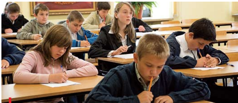
W konkursie wzięło udział 52 uczestników