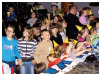
Organizatorzy zadbałi o dobrą zabawę