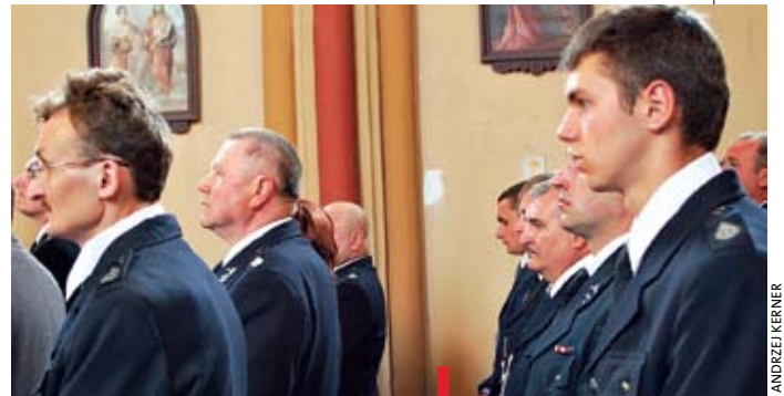
Msza św. w intencji strażaków w Jakubowicach

W sobotni wieczór 8 maja Jakubowice przeżyły prawdziwy najazd strażaków. Było ich chyba więcej niż mieszkańców! Bo ta mała, pięknie położona nadgraniczna wieś w dekanacie branickim liczy ich nominalnie 125. Tymczasem tutejsi mieszkańcy zorganizowali obchody ku czci św. Floriana nie tylko dla gminy Branice, ale również dla zaprzyjaźnionych strażaków z gmin po południowej stronie granicy. Św. Florian