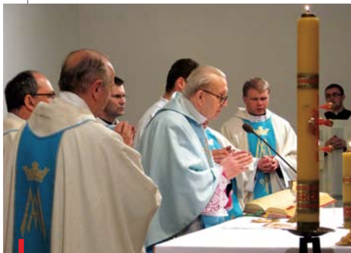
Mszy św. na rozpoczęcie II Tygodnia Społecznego przewodniczył bp Edward Materski