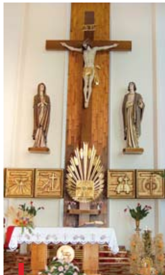
W wystroju prezbiterium umieszczono plafony przywołujące sakramenty