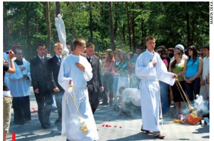
Podczas ubiegłorocznego Dnia Młodzieży w „Emaus” poświęcono figurę Matki Bożej Pielgrzymującej

20.15 - Apel, modlitwa końcowa i błogosławieństwo. Szczegółowe informacje o spotkaniu na stronie www.mlodzira-dom.pl. ■