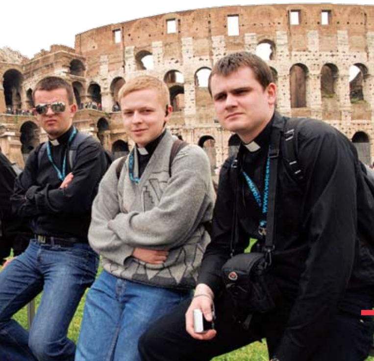
Chwila odpoczynku przed Koloseum

Późnym popołudniem pełni wrażeń wyruszyli autokarami w stronę Polski. ■