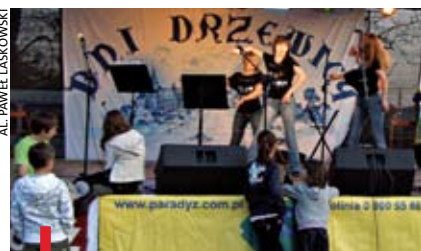
AL. PAWEŁ JASKÓWSKI

Jeden z wielu koncertów podczas Dni Drzewicy