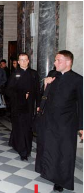
Spotkanie z abp. Zygmuntem Zimowskim