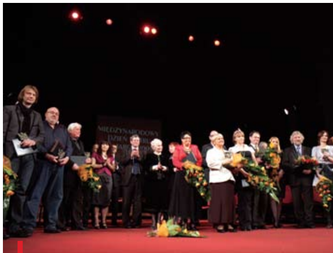
Tegoroczni laureaci Złotych Masek