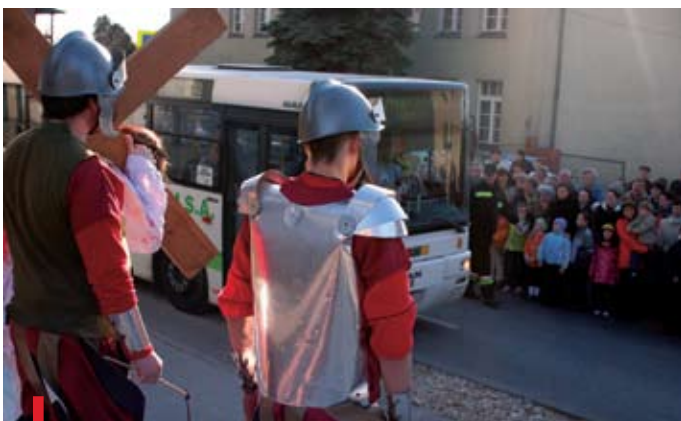
Aktorzy, nawet Jezus, musieli poczekać, aż przejedzie autobus