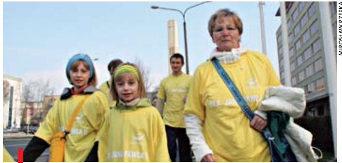
Uczestnicy marszobiegu wyruszyli spod kościoła Wniebowzięcia Najświętszej Maryi Panny chwilę po godz. 9.00

Już rano rozpoczęły się 2 kwietnia w Katowicach obchody 4. rocznicy śmierci papieża Jana Pawła II.