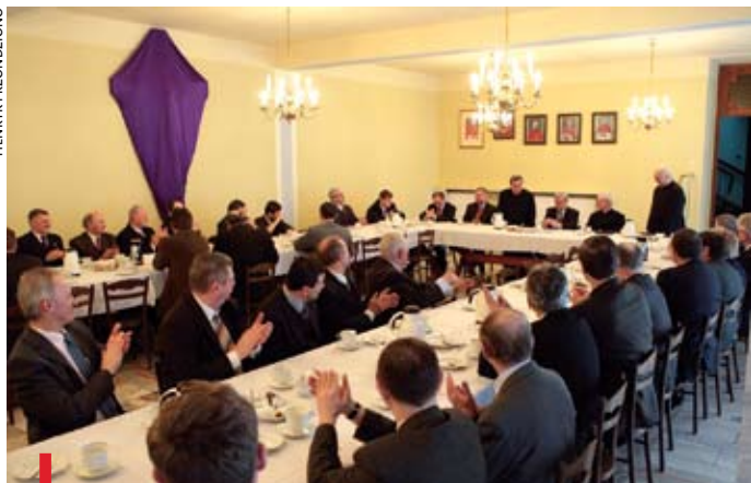
Parafia św. Jadwigi w Rybniku była jednym z miejsc spotkań samorządowców

przedstawiony został referat: „Wojciech Korfanty jako twórca i świadek chrześcijańskiej tożsamości narodu”. Omówiono w nim m.in. rolę Kościoła w życiu Korfanteo, zasadę solidaryzmu społecznego, której hołdował, społeczny i narodowy aspekt jego działalności. Na zakończenie samorządowych dni skupienia odprawiona została Msza św.