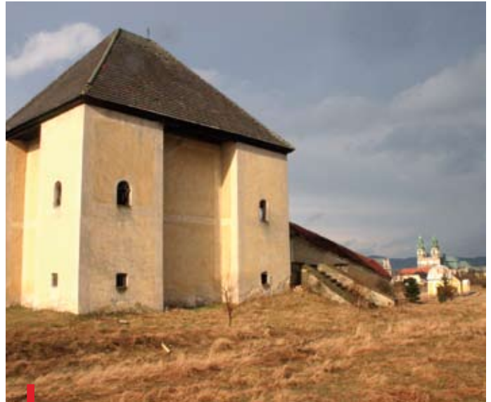
Do tej stacji krzeszowskiej Drogi Krzyżowej wiodą tzw. Święte Schody