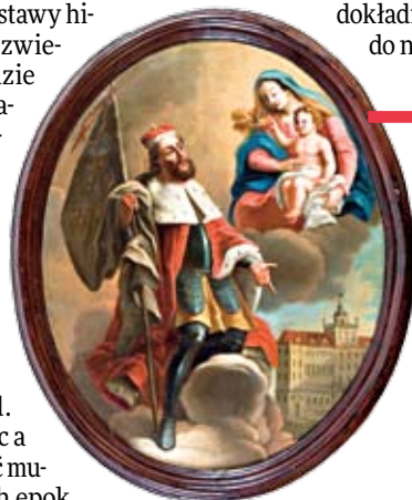
Wystawa opowie m.in. o dziejach wrocławskiego uniwersytetu – tu św. Leopold polecający Madonnie Uniwersytet Wrocławski (ze zbiorów kościoła Imienia Jezus we Wrocławiu)

Oprócz wystawy historycznej na zwiedzających będzie czekać m.in. galeria wrocławskiej sztuki, w której znajdą się przede wszystkim dzieła z ostatnich 200 lat czy odrestaurowany barokowy ogród. Interesująca może się okazać muzyka z różnych epok,