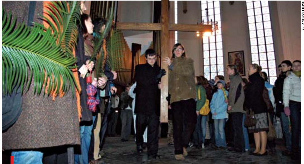
Poprzedni ŚDM we Wrocławiu

Niedziela Palmowa na Ostrowie Tumskim może okazać się zaskakująca. Muzyka, świadectwa, pantomima i poprzedzająca Mszę św. procesja z palmami, w której pojawią się niezwykle postacie, przeniosą nas do Jerozolimy , w tłum ludzi witających Zbawiciela.