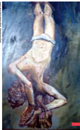
Praca Jerzego Kapłańskiego