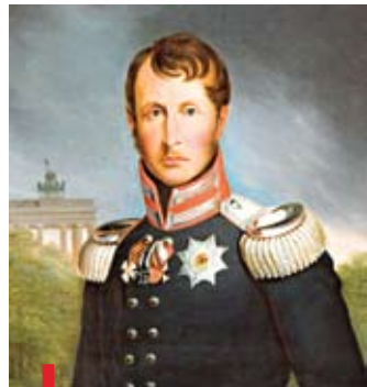
Król Fryderyk Wilhelm III, jeden z mieszkańców pałacu (portret autorstwa Ernsta Gebauera ze zbiorów Muzeum Miejskiego Wrocławia)

butelki, ale także militaria, rzemiosło artystyczne.