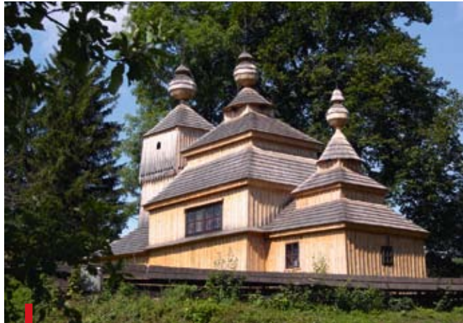
Drewniane cerkiewki Słowacji urzekają nie tylko pięknem architektury, ale także wnętrzem

Do 10 lutego 2009 r. w Państwowym Muzeum Archeologicznym w Warszawie można oglądać ekspozycję „Świat karpackich świątyń. Sztuka Kościoła greckokatolickiego na Słowacji”, przygotowaną przez Muzeum Szariskiego w Bardejowie na Słowacji.