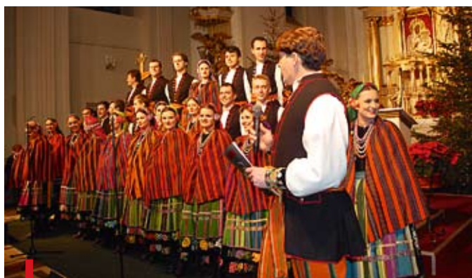
UG W BRWINOWIE

Pięknie, barwnie i wesoło – styczniowy koncert „Mazowsza” w Brwinowie