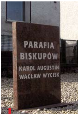
Tablica pamiątkowa we wsi

PO LEWEJ: Chrzcielnica – tu zaczęła się droga wiary bp. Wyciska