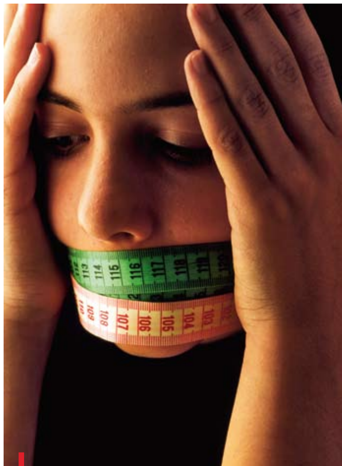
Anoreksja to choroba zakłamań, a nie fanaberia odchudzających się dziewcząt

Samo odchudzanie córki nie musi budzić niepokoju rodziców. Problem zaczyna się, kiedy