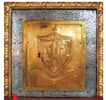
Tabernakulum z herbem biskupim