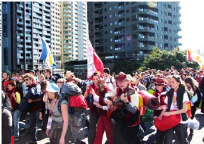
Pielgrzymi z Bielska-Białej i ich przyjaciele w czasie pielgrzymki na hipodrom Randwick

– Zachwyciła nas gościnność Australijczyków. Bo choć teoretycznie kondycja chrześcijaństwa w Australii nie jest najlepsza, tą gościnnością otwierali drzwi Chrystusowi. W Adelajdzie, a później w Melbourne przyjmowali nas Australijczycy, w samym Sydney – Polonia. Na każdym kroku spotykaliśmy się z wielką serdecznością. Na przykład w Melbourne spotkaliśmy na ulicy polskie małżeństwo. Państwo ci nie mogli gościć pielgrzymów, bo w tych dniach jechali do Polski, ale zaproponowali nam zwiedzanie miasta ich samochodem. Bezinteresownie! My mieliśmy się uczyć być świadkami, a to sami Australijczycy dawali świadectwo. Duch Święty przychodził w lekkim powiewie m.in. przez takie właśnie znaki.