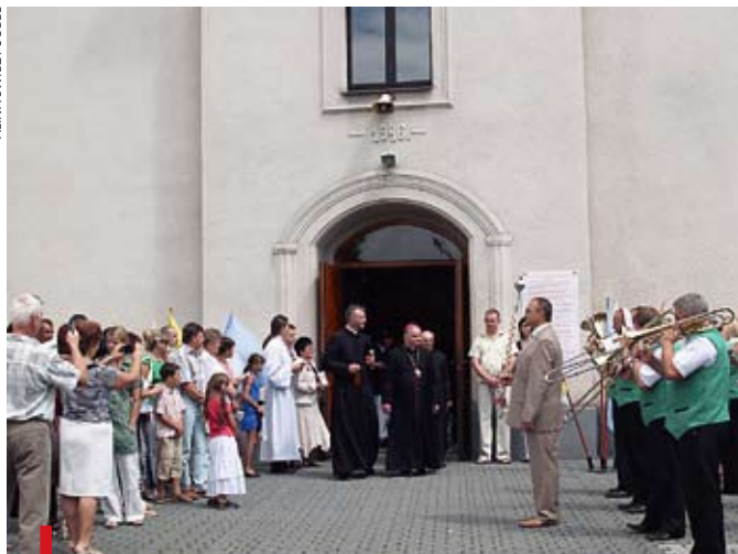
Podczas spotkania z parafianami w Ochabach

przeprowadzenia inwestycji niezbędnych dla dalszej eksploatacji złóż węgla. Kompania Węglowa, zgodnie z sugestiami wicepremiera Waldemara Pawlaka, ma obecnie rozważyć dwie możliwości: samodzielne przeprowadzenie potrzebnych inwestycji albo sprzedaży. Przedstawiciele KW wielokrotnie wcześniej wskazywali jednak na brak środków, jakich wymaga wprowadzenie nowoczesnych rozwiązań w „Silesii”. tm