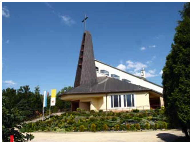
Czekająca na konsekrację mikuszowicka świątynia jest równie piękna jak cała ta dzielnica Bielska-Białej