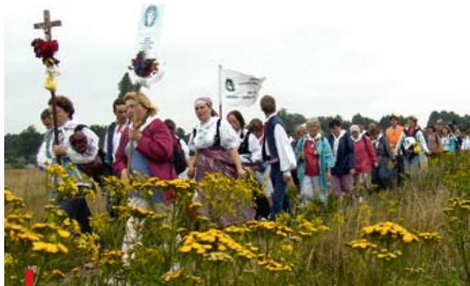
W drodze do Matki