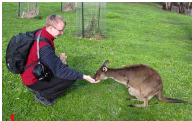
Spotkania z naturą Australii to też nieodłączny element pielgrzymowania na Światowych Dniach Młodzieży

Podczas pobytu w diecezjach był także czas na odwiedziny w australijskich rezerwach przyrody i parkach narodowych, a tym samym – na zdjęcia z misiami koala i kangurami! Do Sydney – to z Adelajdy niemal dwa tysiące kilometrów – nie lecieli samolotem,