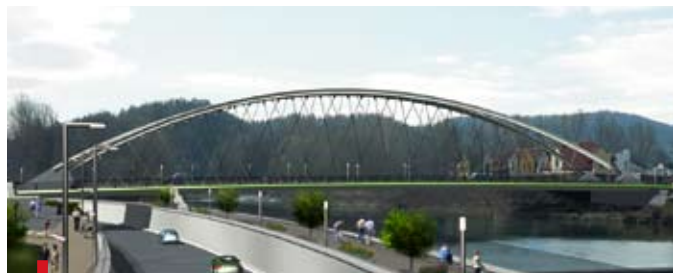
Tak będzie wyglądał nowy most na Sole w Żywcu

ŻYWIEC. Trwają prace projektowe nad nowym mostem w Żywcu. Obecnie na terenie Żywca na rzece Sole znajdują się dwa mosty. Jeden wybudowany kilka lat temu; drugi pochodzi z lat 50. i jego stan techniczny, według fachowców, jest zły. Właśnie na miejscu tej starej przeprawy mostowej wybudowany