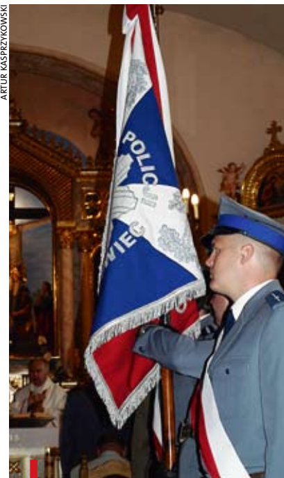
Policjanci w żywieckim kościele Świętego Krzyża