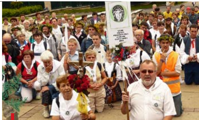
Pielgrzymi z Zaolzia u stóp Maryi