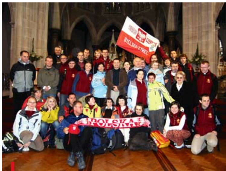
Uczestnicy Światowych Dni Młodzieży z diecezji bielsko-żywieckiej w kościele św. Ignacego w Melbourne