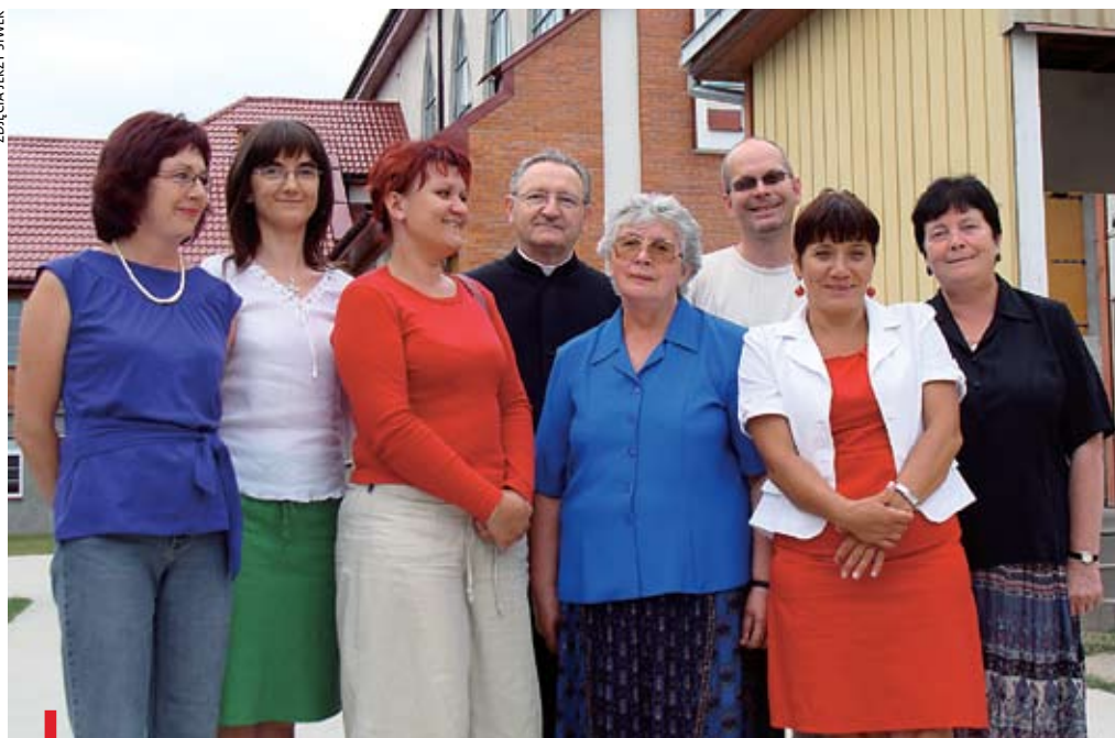
Zespół redakcyjny „Iskierki św. Rafała”

Gdy Jan Paweł II zakończył drugą pielgrzymkę do Polski, władze cofnęły pozwolenie na budowę kaplicy na radomskim Ustroniu. Mimo to zbudowano ją bez pozwolenia.