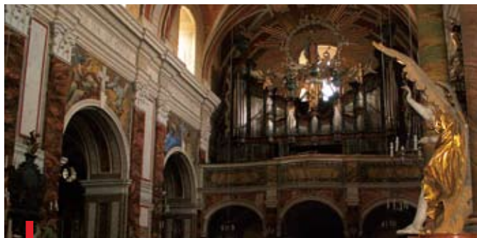
Organ w świątyni w Paradyżu-Wielkiej Woli