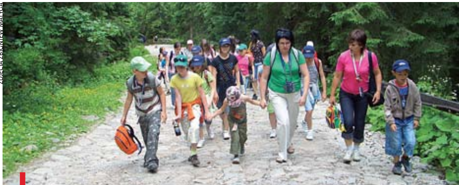
Czasem trzeba było pokonać strome podejścia na górskich szlakach