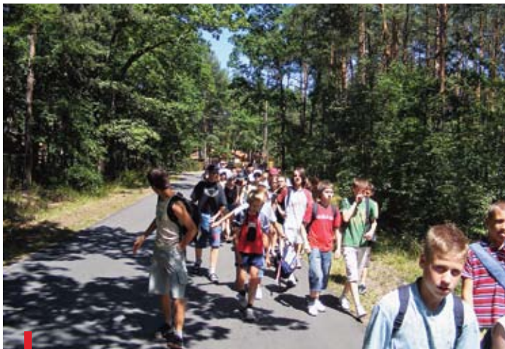
W czasie trwania obozu jego uczestnicy chętnie chodzili na spacerunki po okolicznym lesie

O tym niezwykłym miejscu, małowniczym i wyjątkowym, już nie raz wspominaliśmy na łamach naszej gazety. Tym razem zaglądamy tam, żeby podpatrzeć, jak młodzi ludzie wykorzystują swój wakacyjny czas. Po raz pierwszy do Ośrodka Edukacyjno-Charytatywnego „Emaus” w Turnie koło Białobrzegów przyjechały dzieci i młodzież z grup duszpasterskich przy parafii pw. Miłosierdzia Bożego w Przysusze. Jak sami mówią, czuli się tam jak w domu, choćby z tego powodu, że kaplica na terenie ośrodka jest pod takim samym wezwaniem jak ich parafialny