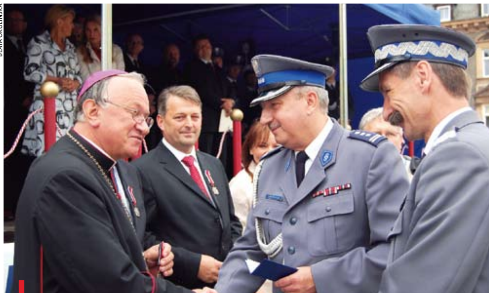
RADOM, 24.07.2008. W czasie obchodów Święta Policji bp Zygmunt Zimowski znalazł się w gronie osób, które otrzymały medal „Za zasługi dla Policji”

Uroczyste obchody Święta Policji Garnizonu Mazowieckiego miały miejsce na placu Konstytucji 3 Maja w Radomiu. Po złożeniu kwiatów przed Grobem Nieznanego Żołnierza rozpoczęła się Msza św. sprawowana pod przewodnictwem bp. Z. Zimowskiego. Następnie podczas uroczystego apelu z rąk Mazowieckiego Komendanta Wojewódzkiego Policji nominacje otrzymali reprezentanci komend miejskich i powiatowych, oraz komendy wojewódzkiej. Doceniono nie tylko policjantów i pracowników policji, ale także osoby spoza środowiska mundurowych. Wśród nich znalazł się biskup ordynariusz, który „Za zasługi dla Policji” otrzymał brązowy medal. Kontynuacją policyjnego święta był festyn rodzinny, poprzedzony musztrą paradną, zaprezentowaną przez Orkiestrę Reprezentacyjną Policji. ■