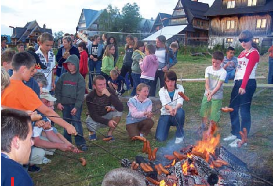
Najlepiej smakuje kiełbaska, którą samodzielnie upiecze się w ognisku

To był aktywny wypoczynek: zdobywali górskie szczyty, brodzili w bystrych strumieniach. Ale głównym punktem dnia zawsze była Msza św.