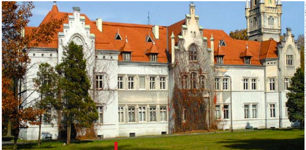
Pałac Donnersmarcków przy ul. Parkowej 1 w Nakle Śląskim. Tutaj znajduje się Galeria „Barwy Śląska”

Nie sztuką być starym, ale sztuką jest pięknie się zestarzeć . Na to jednak trzeba pracować przez całe życie.