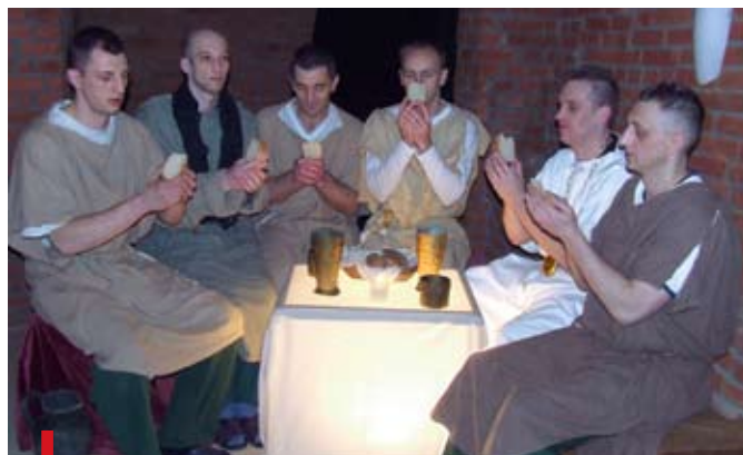
Finałowa scena, gdy strach zostaje pokonany przez Chrystusa, którego symbolizuje światło i chleb