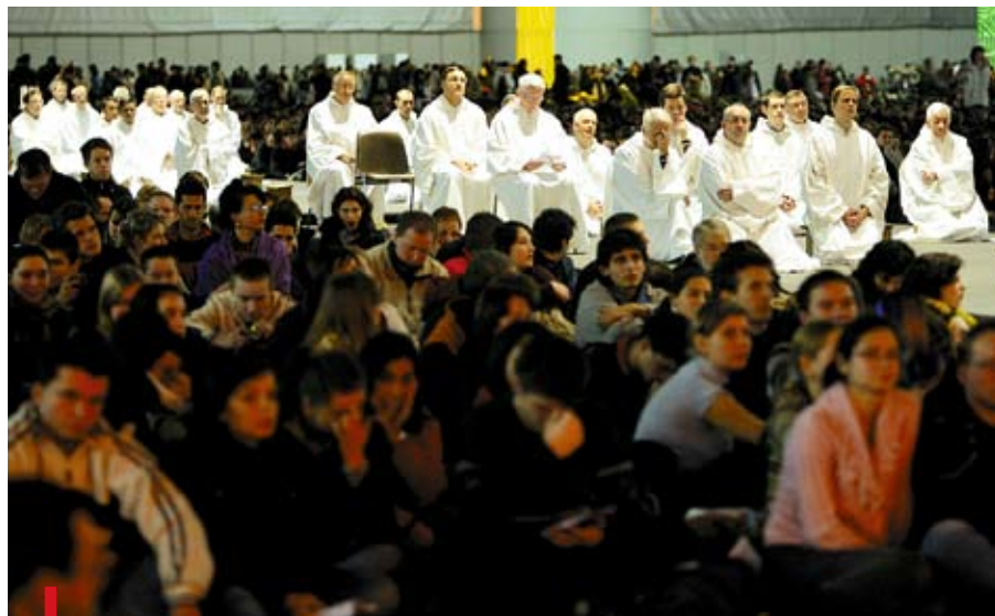
XXX Europejskie Spotkanie Młodych. Oczekiwanie na rozpoczęcie modlitwy wieczornej

Modlitwa śpiewami Taizé odbywa się także w katedrze gliwickiej w III piątek każdego miesiąca o godz. 19.00, a w radiu Plus Gliwice w ostatnią niedzielę miesiąca o godz. 22.30. ■