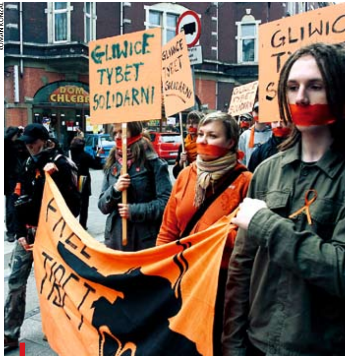
Zaklejone usta na znak solidarności z prześladowanymi w Tybecie, którzy u siebie nie mają głosu

GLIWICE. Z rynku pod budynek Urzędu Miejskiego przeszli w marszu milczenia ci, którzy 5 kwietnia chcieli zaprotestować przeciw łamaniu praw człowieka w Tybecie. Eurodeputowana Genowefa Grabowska przywiozła z Parlamentu Europejskiego flagę przekazaną przez organizacje tybetańskie. Na rynku zabrał głos m.in. górnik z kopalni „Sośnica”, który zauważył, że „zwykli, prości ludzie nie rozumieją tej sprawy, trzeba im wytłumaczyć, wtedy zaprotestować tysiąc osób”. Jak zaznaczyli organizatorzy, nie była to akcja antychińska, ale protybetańska. Jej celem nie było też nawoływanie do bojkotu olimpia-