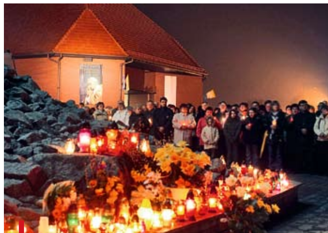
Zabrzańscy modlili się o beatyfikację Jana Pawła II przy krzyżu papieskim