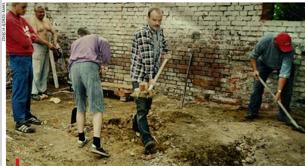
Remonty w Brunowie toczą się bez przerwy;

Parafia Brunów od kilku lat przechodzi wielki remont.