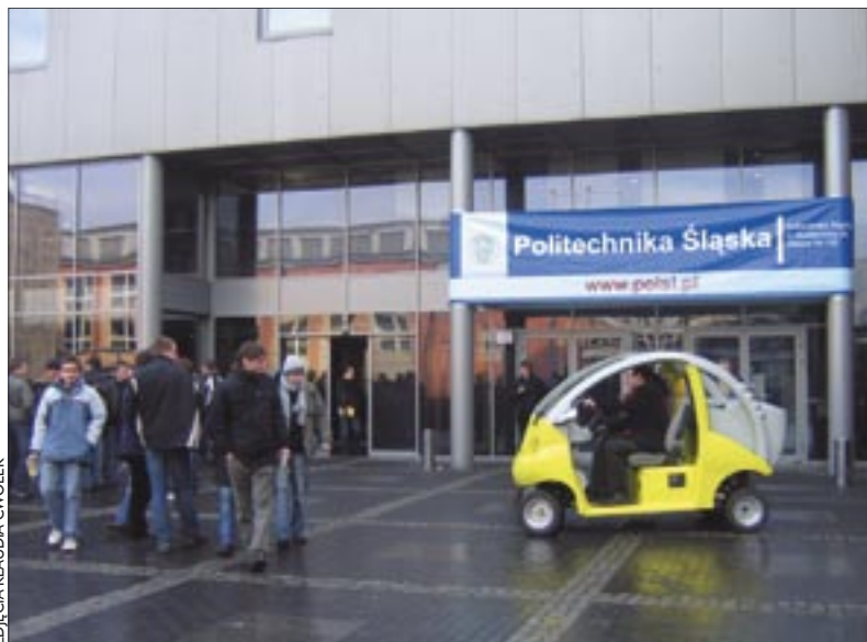
ZDJĘCIA KLAUDIA CWOŁEK