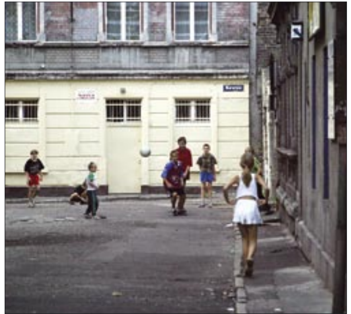
Wiele śląskich gwiazd sportu piłkę zaczęło kopać na podwórku obok familoka

Podobnych sytuacji było bardzo dużo. Jest wiele prawdopodobne, że emocje się powtórzą. Zbliża się 60. rocznica powstania Górnika Zabrze. Planowany jest mecz towarzyski z udziałem jednej z wielkich drużyn. W ankiecie na stronach internetowych jednego z fanklubów Górnika internauci głosują, kogo chcieliby z okazji jubileuszy zobaczyć w roli przeciwnika. Na razie najwięcej opowiedziało się za meczem Górnik Zabrze–AS Roma.