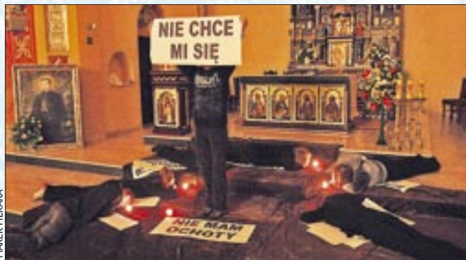
„Siedem grzechów głównych” – pantomima w wykonaniu młodzieży z parafii w Bobrownikach

BOBROWNIKI. Od niedzieli 16 do wtorku 18 września w parafii Przemienienia Pańskiego trwało triduum do św. Stanisława Kostki, patrona młodzieży. W spotkaniach uczestniczyło około 200 osób z tej i sąsiednich parafii. Oprócz codziennej Eucharystii i sakramentu pokuty odbył się koncert zespołu Przecinek z Raciborza, a młodzież z Bobrownik pod kierun-