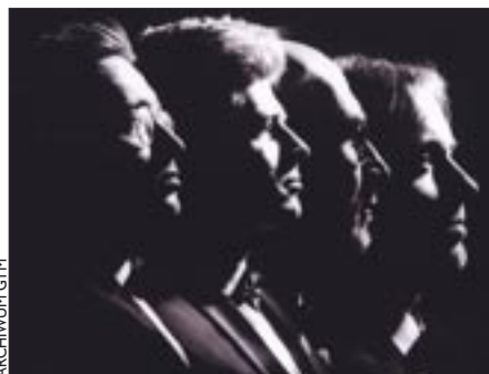
Kwartet Śląski powstał w 1978 r. jako zespół studentów AM w Katowicach

tych kompozycji usłyszymy także ostatnie dzieło Jana Sebastiana Bacha – „Die Kunst der Fuge” BWV 1080. Wstęp na koncert jest wolny. ■