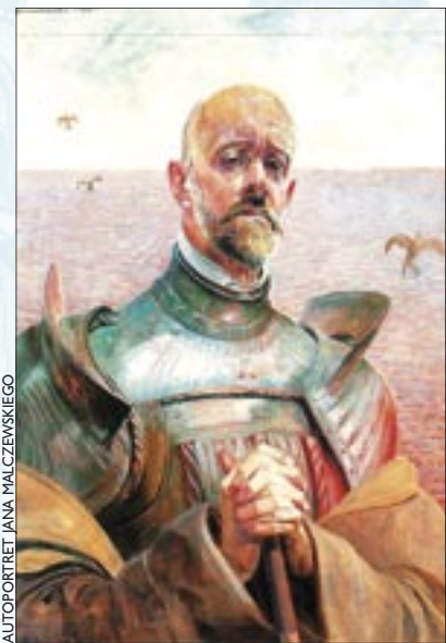
AUTOPORTRRET JANA MALCZEWSKIEGO Niedzielenki. Wystawę można odwiedzać do końca kwietnia przyszłego roku.