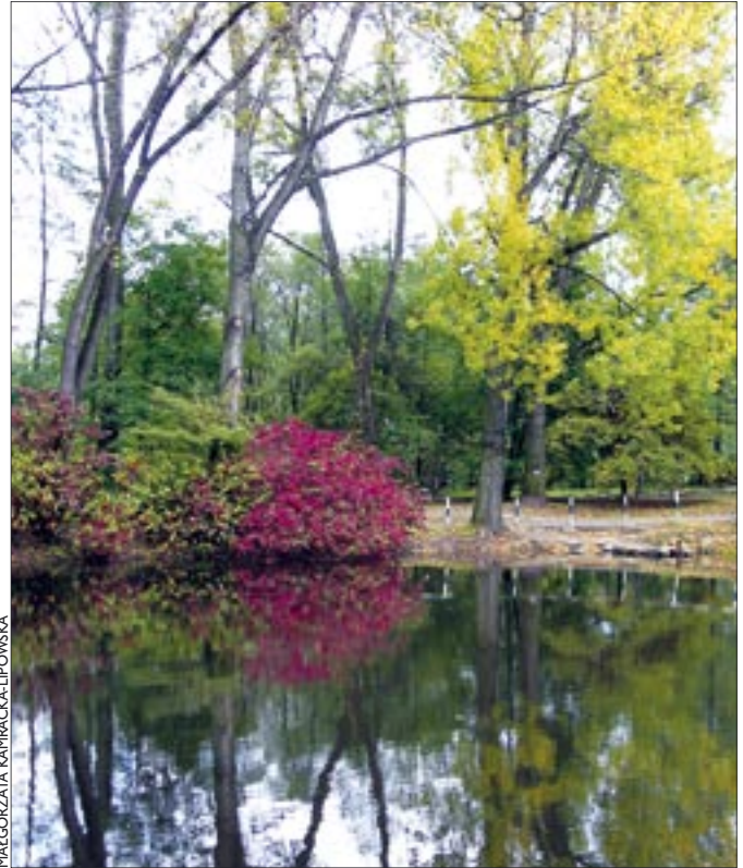
Szeleszczące pod nogami liście, ciepłe jeszcze słońce, paleta barw na drzewach – jak tu nie śpiewać o jesieni?