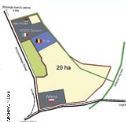
Teren złotoryjskiej podstrefy ekonomicznej

ZŁOTORYJA. Do końca przyszłego roku ma rozpocząć działalność nowa firma w złotoryjskiej podstrefie Legnickiej Specjalnej Strefy Ekonomicznej. Włoska firma Adeo Screen będzie produkowała ekrany do monitorów komputerowych oraz wielkie ekrany kinowe. Do tej pory Adeo Screen produkowała swoje wyroby jedynie we Włoszech. Złotoryja jest pierwszą zagraniczną inwestycją firmy Adeo Screen, na którą wydała ona ok. 11 mln złotych. Przedstawiciele włoskiej firmy deklarują, że do grudnia 2006 roku zatrudnią tam co najmniej 23 osoby.