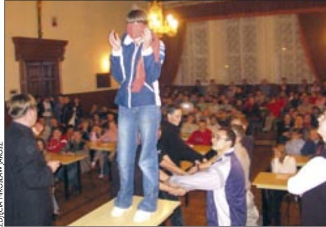
Diakonia Teatralna Effatha podczas spotkania z grupą młodzieży przygotowującej się do bierzmowania. Wiara i zaufanie – te i podobne wartości przekazywane są w niekonwencjonalny sposób

stem tam potrzebny. To jedno z wydarzeń, które było motorem dalszych działań.