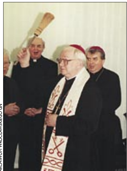
Siedzibę redakcji przy ul. Trzebnickiej poświęcił kard. H. Gulbinowicz