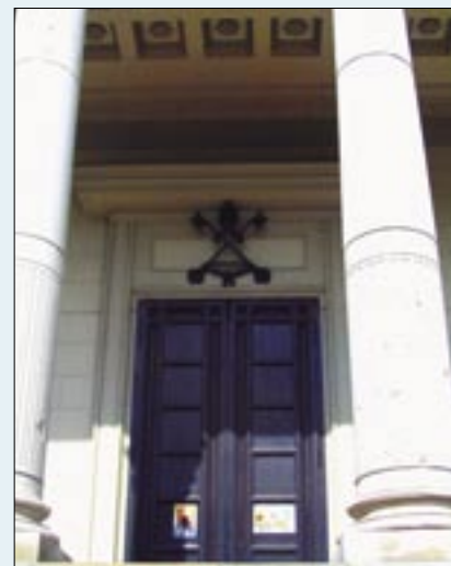
Nad wejściem do świątyni klucze Piotrowe – znak „firmowy” bazyliki