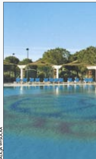
Woda daje latem ochłodę, ale może być też niebezpieczna

KĄPIELISKA. Przed sezonem wakacyjnym sanepid skontrolował stan kąpielisk w Warszawie i okolicach. Aż jedna trzecia wód w okolicach Warszawy nie nadaje się do zażywania letnich kąpeli. Trzeba uważać na kwitnące glony, a zwłaszcza na sinice, które mogą być przyczyną poważnych problemów skórnych. Kąpiel zabroniona jest m.in.: w Bugu – w okolicach miejscowości Brok, w Wiśle – w okolicach Kolonii Nadwiślańskiej i Czerwińska, w Świdrze – w okolicach Radiówka, Otwocka-Świdra, i w Świdrach Wielkich. Bez obaw można się za to kąpać w Jeziorku Czerniakowskim. Wykaz kąpielisk dopuszczonych i zamkniętych przez sanepid znajduje się w internecie na stronie www.wse.waw.pl .