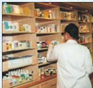
Czy nowe recepty zlikwidują nadużycia?

MAZOWSZE. Od 1 lipca leki refundowane można kupić na Mazowszu tylko na nowe recepty, posiadające kod paskowy.