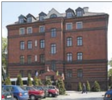
Gmach Wydziału Teologicznego Uniwersytetu Opolskiego przy ul. Drzymały

Spotkanie odbędzie się już po raz trzeci. Organizuje je Wydział Teologiczny Uniwersytetu Opolskiego dla wszystkich absolwentów Instytutu Teologiczno-Pastoralnego Filii Katolickiego Uniwersytetu Lubelskiego w Opolu oraz Wydziału Teologicznego Uniwersytetu Opolskiego. Zjazd rozpocznie się o godz. 11.00 Mszą św. w kościele seminarjno-akademickim pw. św. Jadwigi w Opolu. Później odbędą się spotkania w ramach