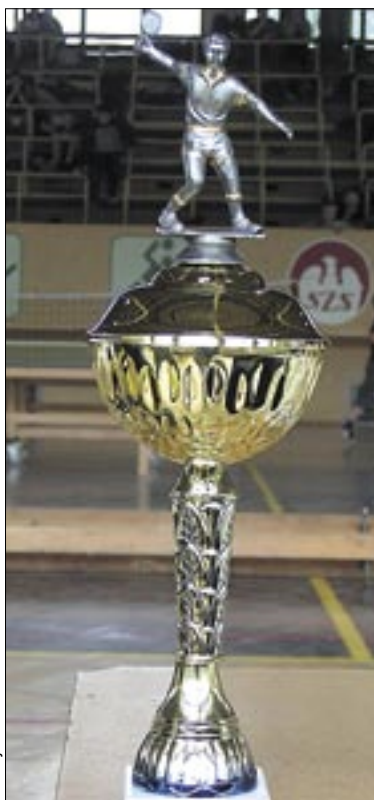
Nagroda dla zwycięzców