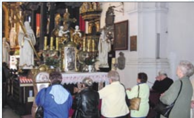
Modlitwa przy grobie św. Jadwigi