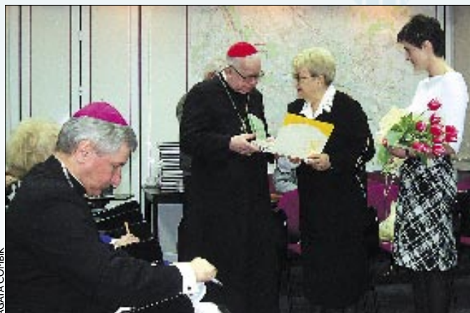
Honorowym gościem konferencji był kard. Henryk Gulbinowicz, od lat wspierający środowisko „entuzjastów Odry”

uwzględnieniem nauczania Jana Pawła II. Wśród kolejnych prelegentów znaleźli się przedstawiciele władz samorządowych, naukowcy i pracownicy rozmaitych instytucji związanych z Odrą. Prezentowali różne aspekty zagospodarowania jej dorzecza – gospodarczy i komunikacyjny, turystyczny i sportowy, kulturalny i ekologiczny. Wiele uwagi poświęcono zapobieganiu klęskom żywiołowym i niezbędnym inwestycjom związanym z rzeką.