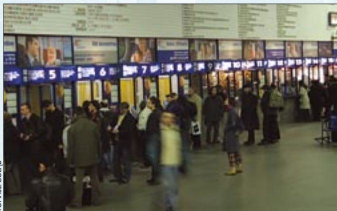
GOŚĆ NIEDZIELNY 10 kwietnia 2005 TOMASZ GOLAB

trzeba kupić 7 dni wcześniej i nie podlega on zwrotowi). 7 kwietnia Intercity uruchomił superszybkie połączenie z Warszawy do Siedlec – podróż trwa godzinę, czyli o połowę krócej niż do tej pory, a na dodatek jest tańsza. W kwietniu Intercity wyposaży konduktorów w terminale, dzięki czemu bilet będzie można kupić w pociągu, płacąc za niego kartą płatniczą. W pociągach będzie też można kupić gazety.