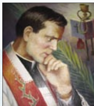
Ks. Popieluszko inspiruje wielu artystów