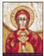
Maryja Stolica (albo Tron) Mądrości autorstwa o. Marko Rupnika, jezuita