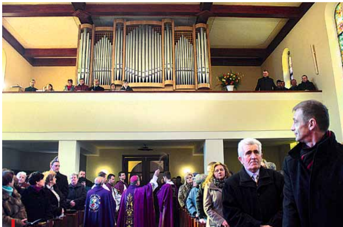
Nowe organy w kościele św. Anny w Babicach poświęcił biskup gliwicki