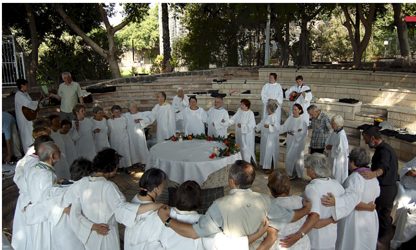
Śpiew i taniec na zakończenie liturgii nad Jeziorem Galilejskim Z PRAWEJ: Podziemne przejścia z czasów rzymskich w sąsiedztwie miejsca, gdzie św. Piotr zaparł się Chrystusa