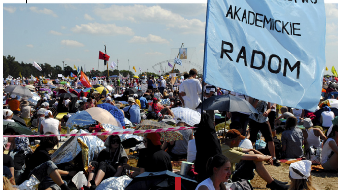
Na lednickim spotkaniu młodych