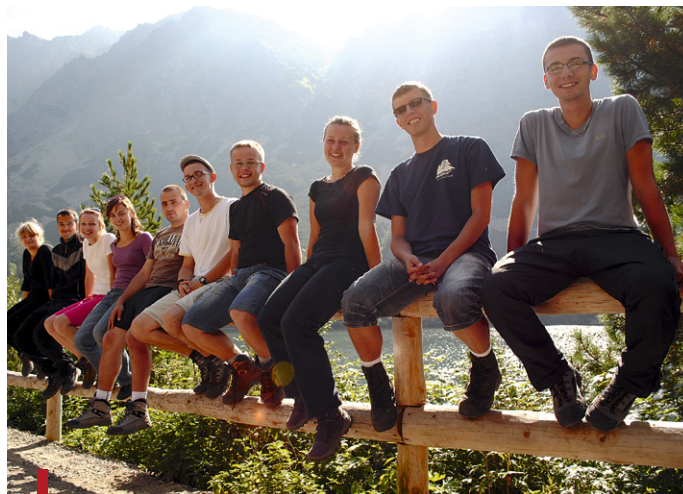
Chwila wytchnienia w drodze na Rysy

Duszpasterstwo pozwala także na rozwijanie swoich pasji podróżniczych, na przykład przez wyjazdy. Jeśli ktoś ma do tego talent, może realizować się jako dziennikarz w „Gazecie Akademickiej”. Wciąż rozrasta się grupa wolontariacka, która angażuje się w różne inicjatywy, m.in. wolontariusze pomagają w szkole specjalnej na Michałowie. Każdy zawsze może coś z duszpasterstwa dla siebie wynieść.