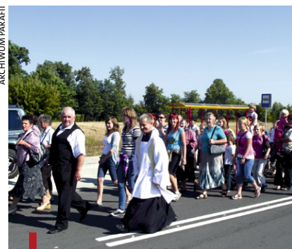
Pogoda była wspaniała. Parafianie zapewnili, że za rok w pielgrzymce weźmie udział ponad pięćset osób