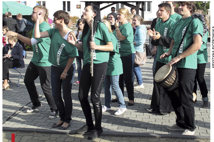
Członkowie scholi „B 16” z Suchedniowa emanowali energią