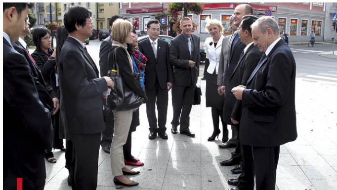
Dokument został podpisany podczas dwudniowej wizyty delegacji miasta Taoyuan w Radomiu