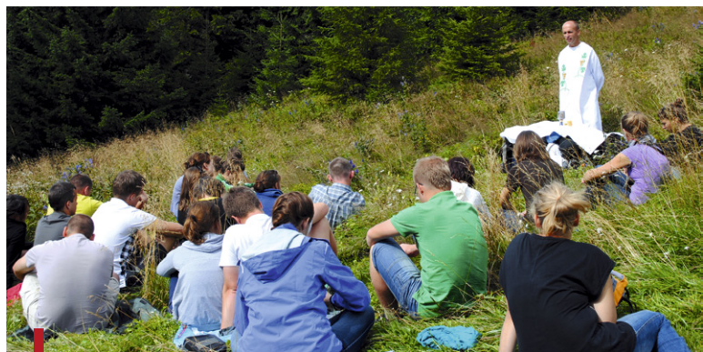
Msza św. w Dolinie Chochołowskiej