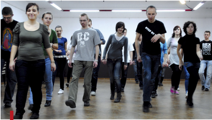
Kurs tańca „You can też” cieszył się dużym zainteresowaniem