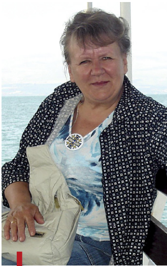
Kochała ludzi i była cenionym psychologiem