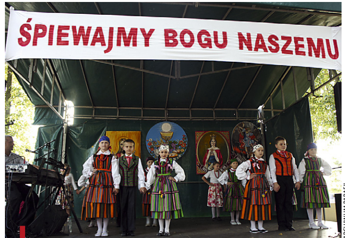
Wszystkim podobały się występy najmłodszych artystów

„Kamienianka” z Kamienia i Zespół Pieśni i Tańca „Cieblowianie” z Cieblowic Dużych. – Spotkanie było niezwykle. Dostarczyło wielu przeżyć duchowych, kulturalnych i sportowych. Licznie zebranych uczestnikom dopi-