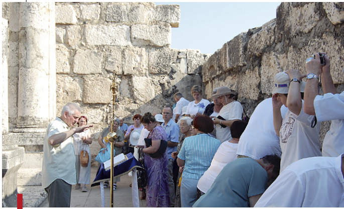
Katecheza w synagodze w Kafarnaum, mieście św. Piotra