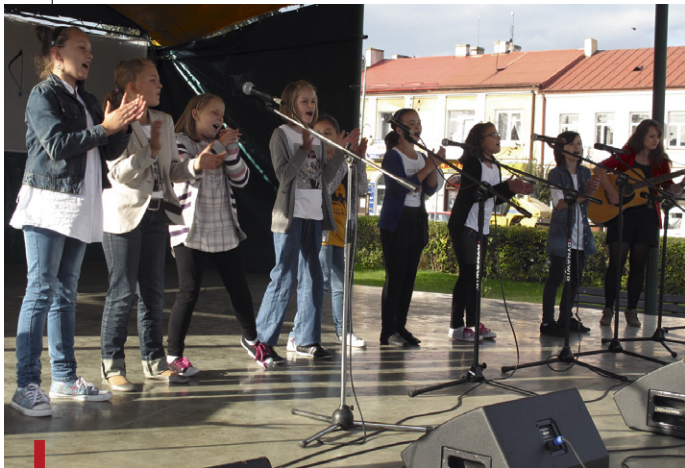
W kat. do lat 16 najlepsza była schola „Moc i potęga” z Przysuchy