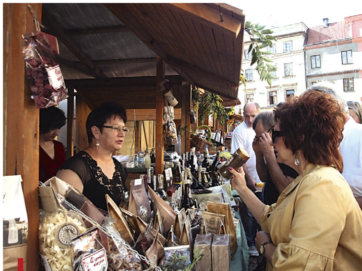
Przed zakupem można było wszystko dokładnie obejrzeć i posmakować