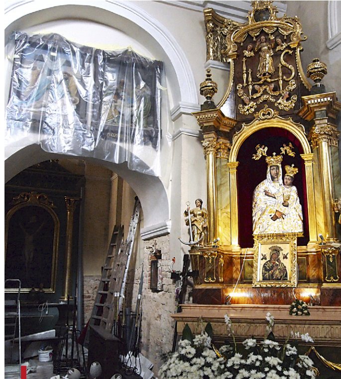
■ We wnętrzu kościoła trwają aktualnie remonty

W księgi parafialne wpisane jest 11 tys. wiernych. Liczba ta jednak nie oddaje rzeczywistości. – Wiele osób ma tu zameldowanie, a mieszka w różnych częściach Polski. Sporo mieszkańców Beżyc wyjechało też za granicę. To prawdziwa plaga w naszej parafii. Choć z drugiej strony ludzie tutaj naprawdę nie mają z czego żyć. W większości jedy-