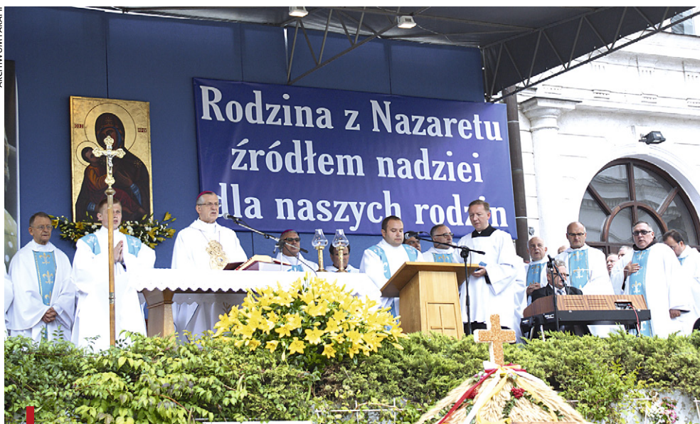
GÓRA CHEŁMSKA, 8 WRZEŚNIA. Msza rozpoczynająca uroczystości odpustowe