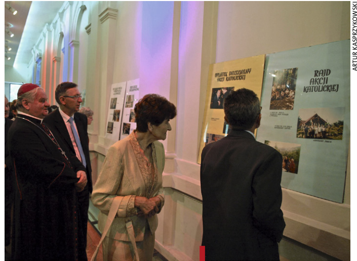
Wystawa o działalności Akcji Katolickiej towarzyszyła jubileuszowym uroczystościom

Licznych sympatyków mają czerwcowe rajdy Akcji. Tegoroczny zakończył się pod Krzyżem Trzeciego Tysiąclecia na Hrobaczej Łące. Od września rozpoczynają się przesłuchania i eliminacje do organizowanego od 2000 roku Przeglądu Piosenki Patriotycznej im. Małgorzaty Papiurek. Wśród organizatorów od początku są Łu-