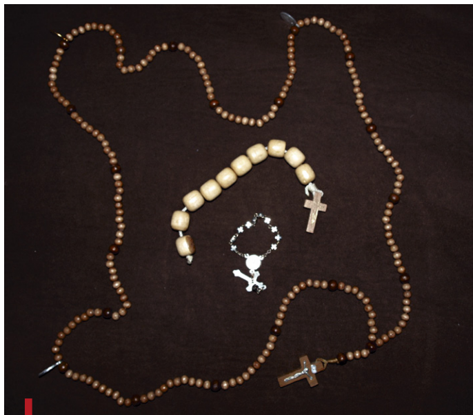
Odmawiaj Różaniec – wszystkie cztery części, albo choć jedną dziesiątkę – zachęcają członkowie Apostolstwa

– Trafiają do naszego „modlitewnego pogotowia” intencje zgłaszane telefonicznie i przez internet. Są też wpisywane do księgi intencji na Kaplicówce. To często prośby o zdrowie, ale też o nawrócenie, zgodę w rodzinie. Tych ostatnich jest coraz więcej – mówi Lidia Wajdzik. ■