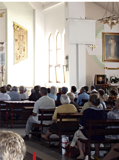
Pompejański Dzień Skupienia ADŚ w Pogórzcu

Co miesiąc setki osób z ADŚ modlą się przed obrazem MB Pompejańskiej na Kaplicówce.