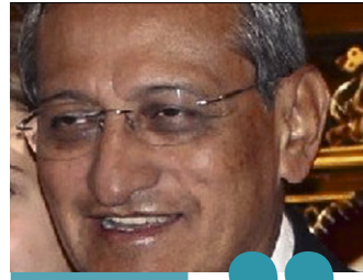
W jubileuszowej modlitwie wezmą udział delegacje Związku Podhalań z różnych stron Polski