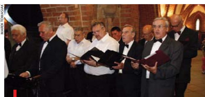
W rudzkiej bazylice modliło się ponad 200 chórzystów