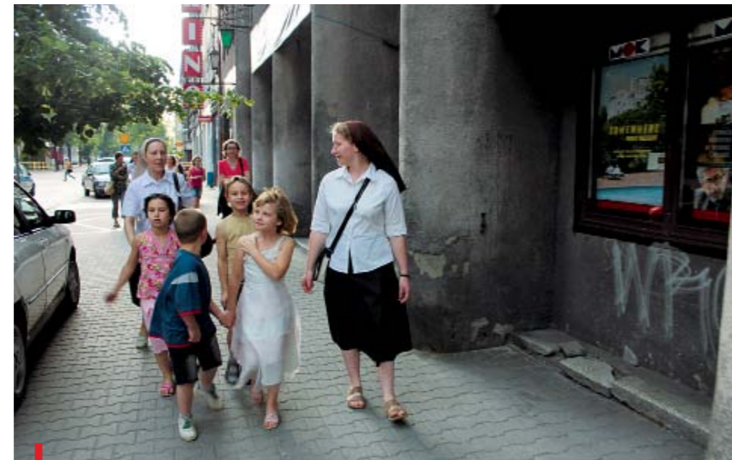
Powrót z premierowego spektaklu w wykonaniu dzieci ze świetlicy środowiskowej

– W całym naszym zgromadzeniu jest tendencja, żeby iść do środowisk, które są trochę na uboczu, odrzucone przez społeczność lokalną, środowisko miasta czy wioski, a czasem nawet Kościoła. Choć miałyśmy bardzo dobre propozycje pracy w parafiach, które uwa-