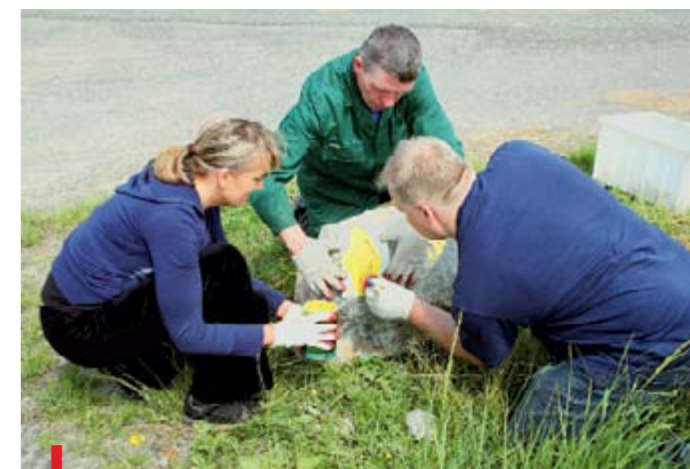
Nyska Droga św. Jakuba oznaczona jest tradycyjnymi muszlami i strzałkami. Trasa łączy się z Drogą św. Jakuba VIA REGIA, prowadzącą do Santiago de Compostela

NA STRONIE OBOK: Nysa to również jeden z największych w Europie system fortów i bastionów, które zagospodarowane służą turystom, nie tylko miłośnikom historii