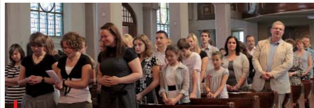
Rozślaniem przed rekolekcjami oazowymi odbyło się w kościele w Zabrze-Rokitnicy

diecezjalny Ruchu Światło-Życie, podkreślił, że rozślaniem jest spotkaniem odpowiedzialnych za letnie rekolekcje i powierzeniem Bogu tego wszystkiego, co się na nich wydarzy, oraz tych, którzy będą w nich uczestniczyć. W tym roku zorganizowanych zostanie 8 turnusów dla dzieci i młodzieży, a w rekolekcjach Domowego Kościoła uczestniczyć będzie ponad 200 osób.