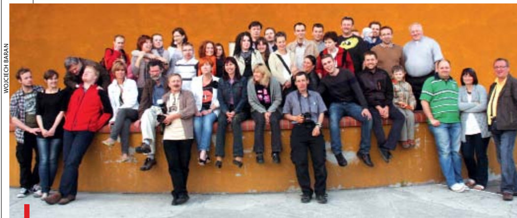
Wspólne zdjęcie przed wejściem do gliwickiej redakcji „Gościa Niedzielnego”