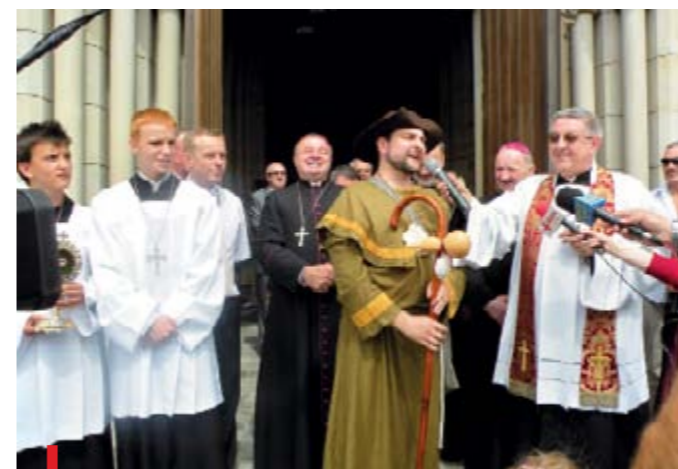
Podczas otwarcia Jarmarku Jakubowego na runku pojawia się św. Jakub. Impreza, która ściąga tłumy turystów, odbywa się w każdą przedostatnią niedzielę lipca (w tym roku 24 lipca)

Prawdziwym rarytasem jest Rynek Solny, z zachowaną