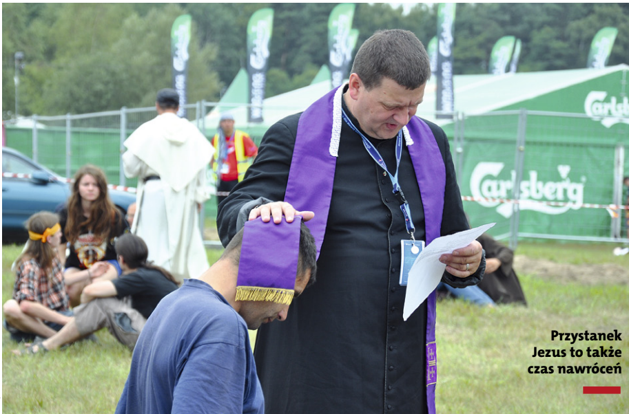
Przystanek Jezus to także czas nawróceń