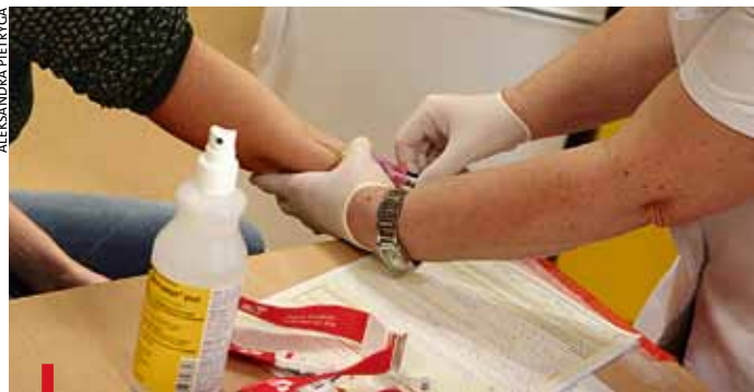
Rejestracja jest prosta – trzeba wypełnić formularz i pobrać krew do badania genetycznego

PIEKARY ŚL. Ponad 150 potencjalnych dawców szpiku zarejestrowało się w bazie Fundacji Dawców