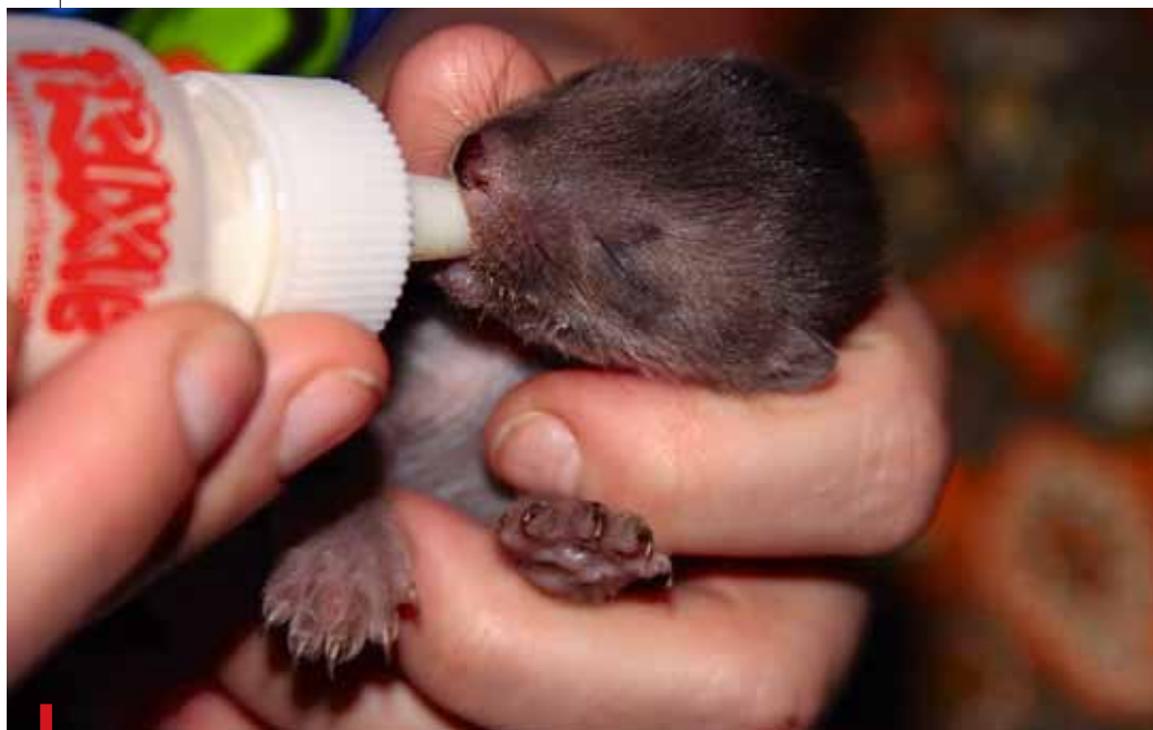
Do Leśnego Pogotowia trafiają młode zwierzęta wymagające podchowania, np. kuny i sowy